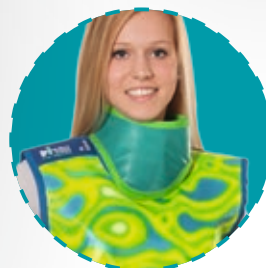
Optional mit Halskrause