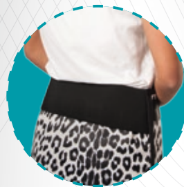
Auf Wunsch mit elastischem Rückenteil