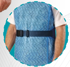
Mit elastischem Gürtel