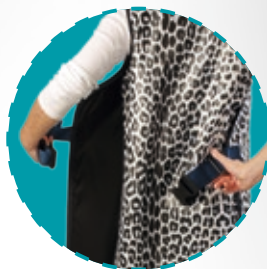
Mit Klettverschluss an den Seiten