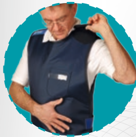
Mit einfacher Schulter- und Seitenschließung