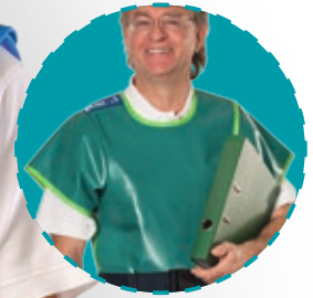
Optional mit angenähtem Ärmel

Schürze mit 100%iger Frontüberlappung und bester Gewichtsverteilung.