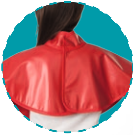
Rückansicht mit optionaler Halskrause